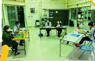
R4年5月 ミニ懇談会を開催