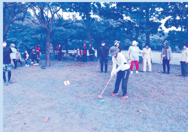
チャリティーグラウンドゴルフ大会