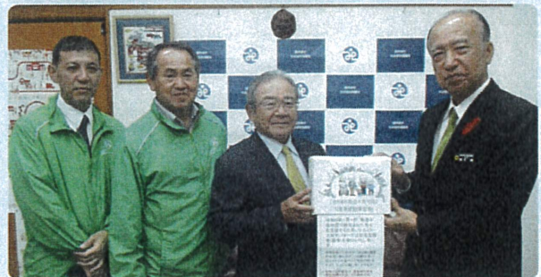
シルバー人材センターの皆さまより、能登半島地震災害義援金の贈呈