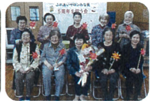
皆で仲良く楽しく介護予防!