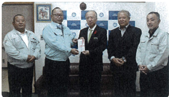
豊見城市建設業協会様より寄付金の寄贈(運天社協会長・写真中央)