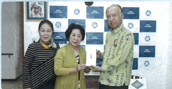
金良ヨガサークルの皆さんより、能登半島地震災害義援金の贈呈