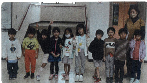
聖マルコ保育園の皆さん