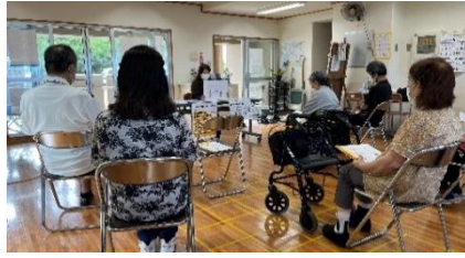
認知症地域支援推進員による講話

知っていますか? マスコット「ロバ隊長」に込められた意味 ロバのように一歩ずつ着実に「認知症になっても安心して暮らせるまちづくり」を先頭に立って進めていこう! という意味が込められています。