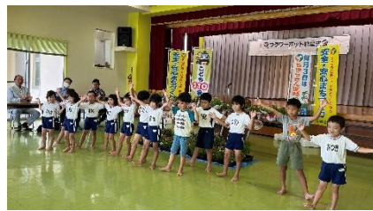
大輝保育園(キリン組)のお遊戯♪